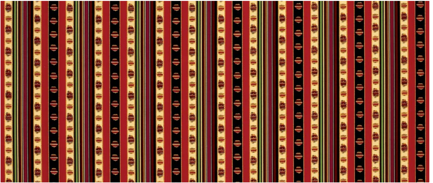
Rayure Cachemire percale - rouge - réf : 11549-1